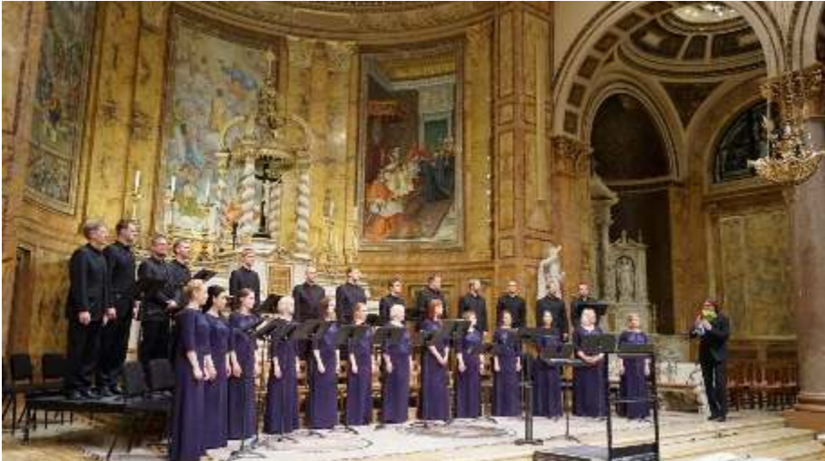
Fotomeenus New-Yorki kontserdist