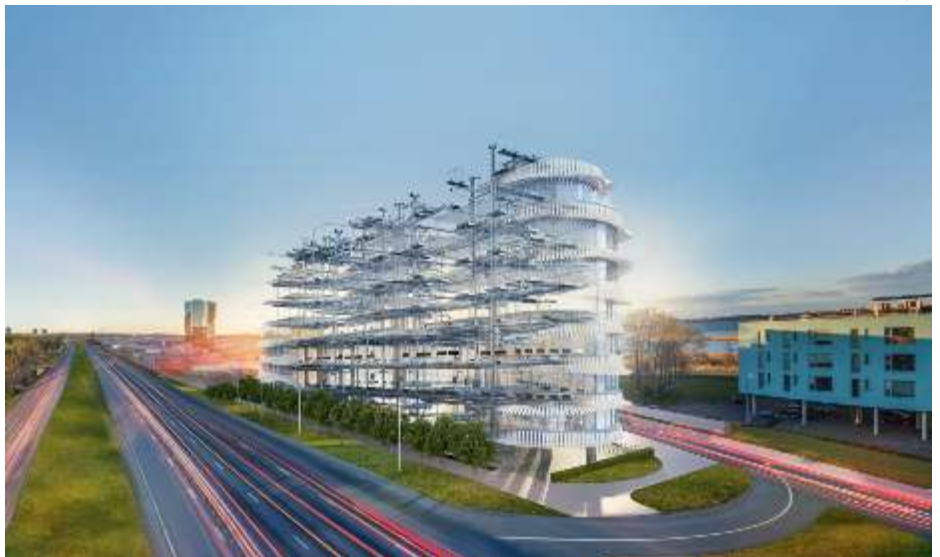
Paldiski maantee 96A - EEL uus kodu

Meie uued kontaktid on leitavad Uudiskirja tagakaanel.