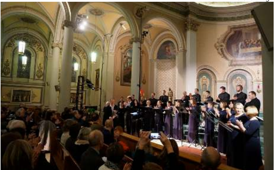
Fotomeenus Toronto kontserdist

Eesti esinduskoori kontserdid on saanud kõrge hinnangu Ühendriikide ajakirjanduses, antud turneest ilmus erinevates USA meediakanalites 9 arvustust. EFK esimene reis toimus 1990. aastal Tõnu Kaljuste juhatusel ning alates 1995. aastast tehakse koostööd agentuuriga New World Classics. Viimasel kuuel aastal on USAs kontserte antud koguni igal hooajal nii a cappella kavadega, samuti koos Tallinna Kammerorkestri, ERSO ja Los Angelese Filharmoniaorkestriga. Dirigentideks on olnud Tõnu Kaljuste, Neeme Järvi ja Gustavo Dudamel, mainekates kontserdisaalides, nagu Los Angelese Walt Disney kontserdimaja, New Yorki Carnegie Hall, Avery Fisher Hall ja Metropolitan Kunstimuseum, Washingtoni Kennedy keskus ja mitmed teised.