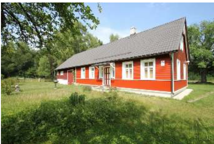
Fotod Ungru loomemajast